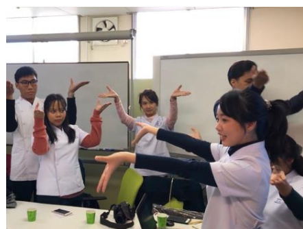
タイ学生によるタイの理学療法に関するプレゼンテーション