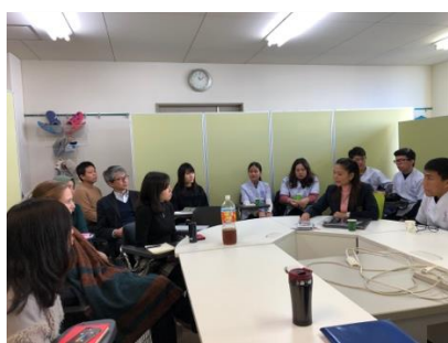
日タイ間の情報交換会